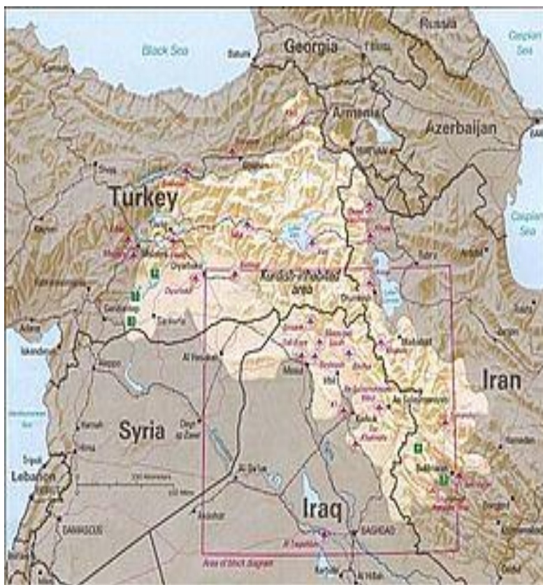
Figura 1- Harta Kurdistanului 1

Astăzi populația kurdă numără între 35 – 40 de milioane de oameni ce trăiesc în special pe teritoriul Turciei (cam 20 de milioane; ceea ce reprezintă 45% din totalul kurzilor și 21 – 25% din populația Turciei), Iran (7-9 milioane, adică 14% din populația iraniană), Irak (4 - 6 milioane), Siria (1,5 – 2 milioane), Liban (aproximativ 300.000), în fostele republici ale URSS se găsesc aproximativ 300.000 de kurzi. Se întâlnesc de asemeni și în Europa, America, Australia, însă numărul lor este foarte mic.