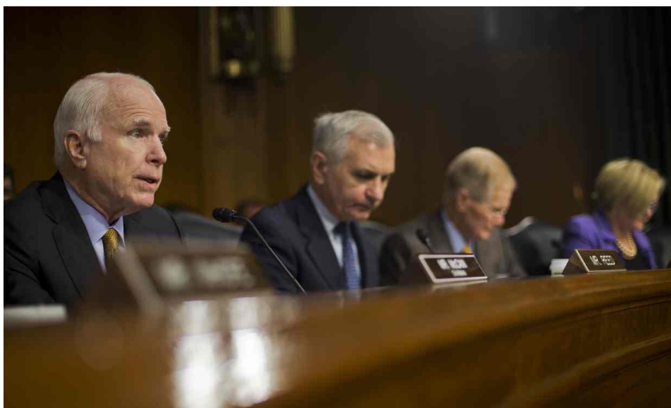
John McCain – ONU, New York

Dacă ne întoarcem cu două săptămâni înaintea acestor evenimente, pe 16 septembrie, generalul Lloyd Austin de la Comanda Centrală a Armatei SUA declara că nu există decât „patru sau cinci” luptători Sirieni antrenați de SUA în lupta împotriva ISIS. Iar după două săptămâni, acești luptători despre care se discuta, controlează o întreagă regiune?! Ceva cu siguranță este neclar în aceasta ecuație. Se poate deduce oare faptul că Washingtonul face niște jocuri la nivel mondial și că desigur, dacă erau doar patru sau cinci luptători antrenați să lupte împotriva ISIS, restul cărora SUA le oferă și armament sunt toți aliați ai ISIS?!