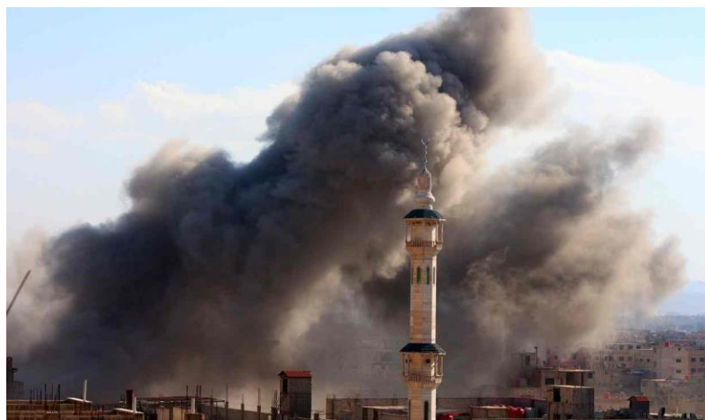
Bombardament rusesc în Damasc – februarie 2016

De asemenea, un lucru foarte îngrijorător este faptul că în ultima jumătate de ani, raidurile aeriene rusești au ucis aproximativ 2000 de civili sirieni. Moscova insistă asupra faptului că ar fi efectuat doar atacuri asupra teroriștilor, însă victimele și luptătorii susțin că bombardamentele au avut loc în zone destul de îndepărtate față de cele ocupate de ISIS.