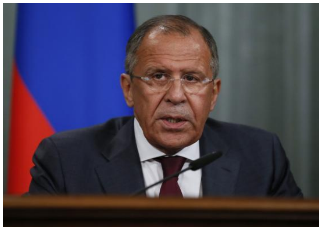
Ministrul de externe Sergei Lavrov, spune că Rusia acționează în legalitate.

Lavrov a respins într-un mod agresiv afirmația Secretarului Apărării SUA, Ashton Carter, cum că Moscova ar „turna benzină pe foc”. „Putem vorbi despre multe incendii cauzate de Pentagon în regiune, dar noi credem că poziția noastră este în absolută conformitate cu dreptul internațional” 1 , a spus mai apoi acesta.