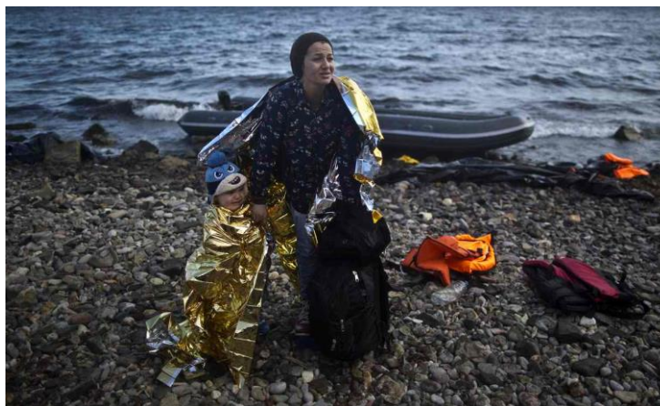
Femeie siriană împreună cu fiul său, ajunși pe coasta Greciei.

Decesele și distrugerea au determinat zeci de mii de sirieni să-și părăsească locuințele din zonele vizate, unii trecând granița în Turcia, unii îndreptându-se spre Europa, iar alții adunându-se în taberele de refugiați de pe teritoriul Siriei.