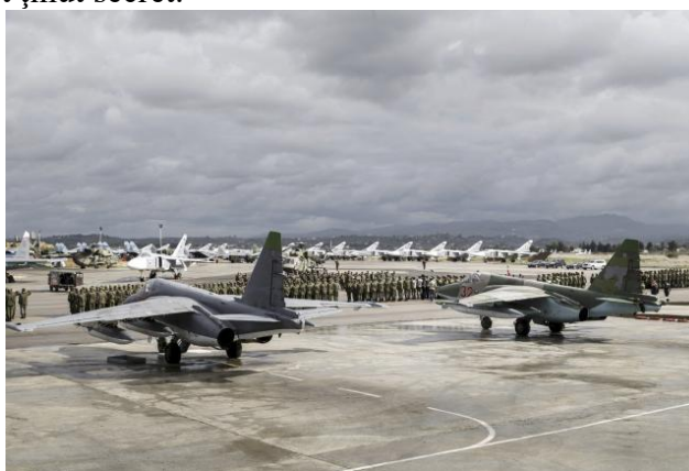
Ceremonie militară de retragere a trupelor rusești din Siria

Reuters a estimat că Rusia și-a retras aproximativ jumătate din forța aeriană din Siria, care a zburat în afara țării în primele zile după ce retragerea a fost făcută publică, însă numărul exact de avioane ale Rusiei a fost ținut secret.