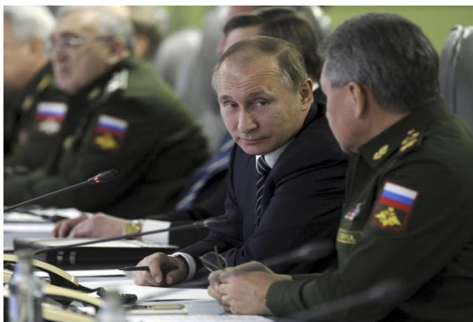
Putin și Ministrul Apărării, Sergei Shoigu, la Centrul Național de Control al Apărării, Moscova

În schimb, la trei zile de la declarația din 14 martie a lui Puțin, Yauza a părăsit portul rusesc din Marea Neagră, Novorossiysk, îndreptându-se către Tartous și transportând o încărcătură extrem de grea. Nu se știe ce transportau navele sau cât de mult echipament a fost transportat în avioane de marfă gigantice, însoțite de avioane de război. 2 Mișcările sugerează însă faptul că Rusia lucrează intens pentru a-și menține infrastructura militară în Siria.